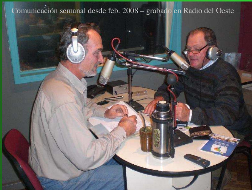
Programa retransmitido por gentileza de periodistas agropecuarios en radios de alcance regional y nacional - del suroeste y litoral oeste del país